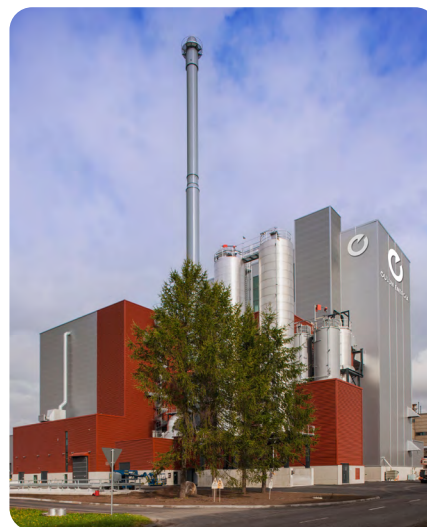
Syklon ekovoimalaitos tuottaa energiaa polttokelpoisesta jätteestä.